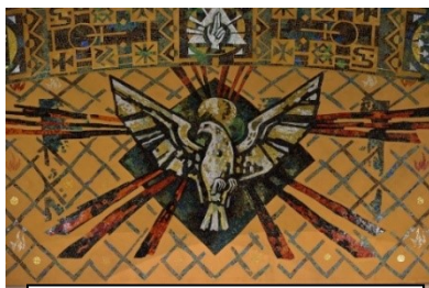
Mosaïque de l'Esprit Saint